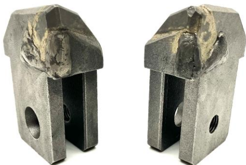
①②RCB40外刃・内刃(40×80×118) 用途：40mm巾脱着式ビット 右回転用