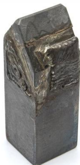
⑥HW45FF(45×45×130) 用途：外刃 (サイドチップ付)