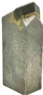
⑯HW22RW(22×32×76) 用途：地中障害撤去等