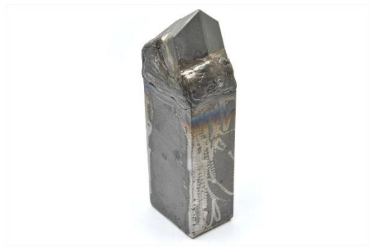
⑪HW50KD2(50×70×220) 用途：杭引き抜き工法等