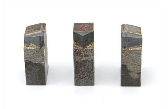
⑰⑱HW20RH右左(20×32×60) ⑲HW20RG中(20×32×60) 用途：鋼管杭等