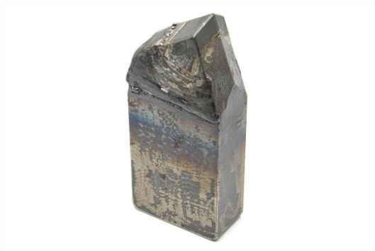
⑭HW40KP(40×80×180)〔差し刃〕 用途：杭引き抜き工法等