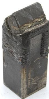
④HW45FE(45×45×130) 用途：柱状改良工法等