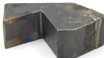
⑦HW40FY2(40×50×110) 用途：攪拌翼取付 (角度切欠き付)