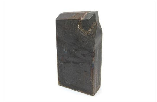
⑮HW30RN(30×70×150)〔差し刃〕 用途：杭引き抜き工法等