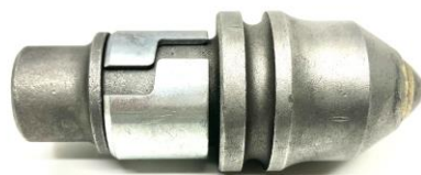
③CB30 (Φ30-Φ50×128) 用途：コニカルビット