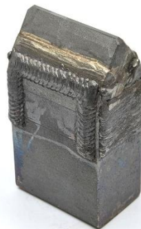
⑤HW70FE (70×45×130) 用途：柱状改良工法等